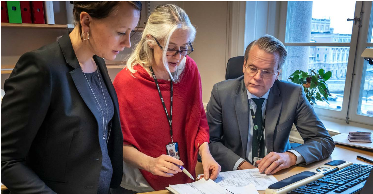
Kanslipersonal på miljö- och jordbruksutskottet går igenom veckans agenda.