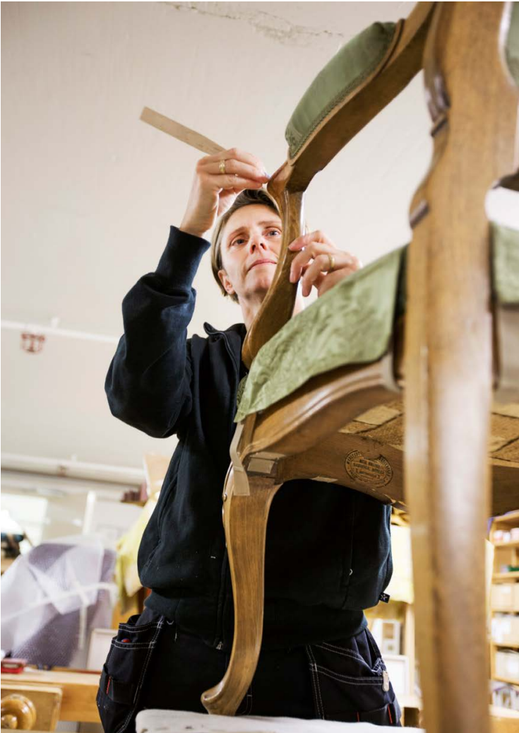
En stol som ingick i originalinredningen i början av 1900-talet renoveras i förvaltningens snickeri.