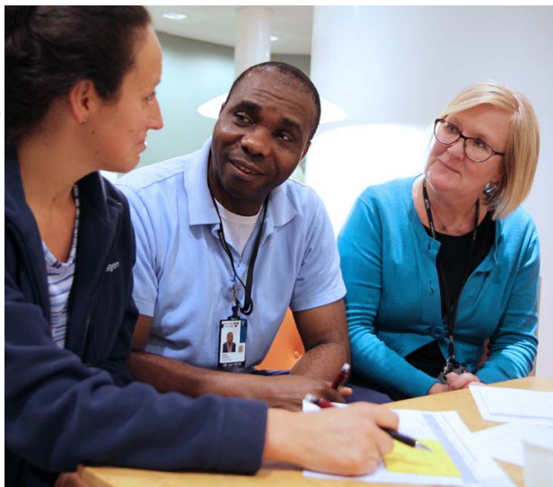
I en workshop diskuterar medarbetare Riksdagsförvaltningens strategiska plan för de kommande åren.