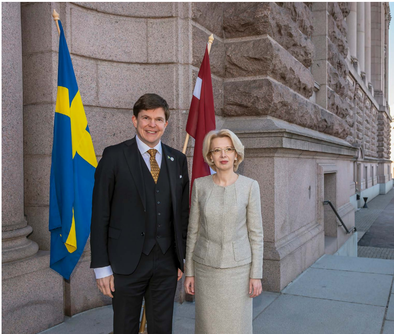
Lettlands talman Ināra Mūrniece hälsas välkommen av talman Andreas Norlén.