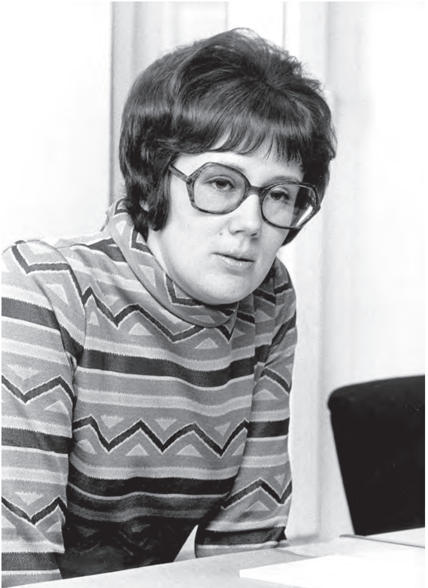
Lena Hjelm-Wallén 1973, året innan hon utsågs till statsråd.