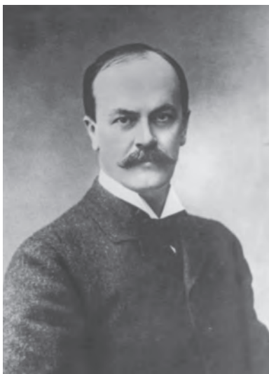
Louis De Geer d.y., statsminister i en opolitisk s. k. expeditonsministär 1920–1921 sedan Brantings första socialdemokratiska regering avgått efter bara ett halvår.

Av olika skäl kom frågan om riksdagen att avgöras innan författningsfrågan som helhet slogs fast. Därför stannar berättelsen när första kammaren tog adjö i december 1970. Den inleds när författningen aktualiserades på nytt i slutet av 1940-talet. Omvälvningen kring 1920, hotet från totalitära läror samt krigsårens åsidosättande av det vanliga politiska livet bidrog till att författningsfrågan fram till dess legat still.