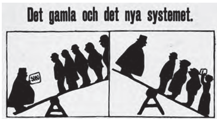
Det gamla och det nya. Socialdemokratiskt flygblad 1910.