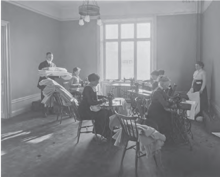
Bondetåget 1914 var välorganiserat. Det krävdes sängplatser och mat för de tillresta bönderna. Bilden visar den s. k. Bondetågsbyrå.

1920 hade också statsrådets roll i praktiken förändrats. Redan 1905 hade under unionskrisen en helt ny regering tillsatts som företrädde riksdagens olika riktningar. 1917 hade den tilltänkte regeringsbildaren Nils Edén utverkat ett löfte av kung Gustaf