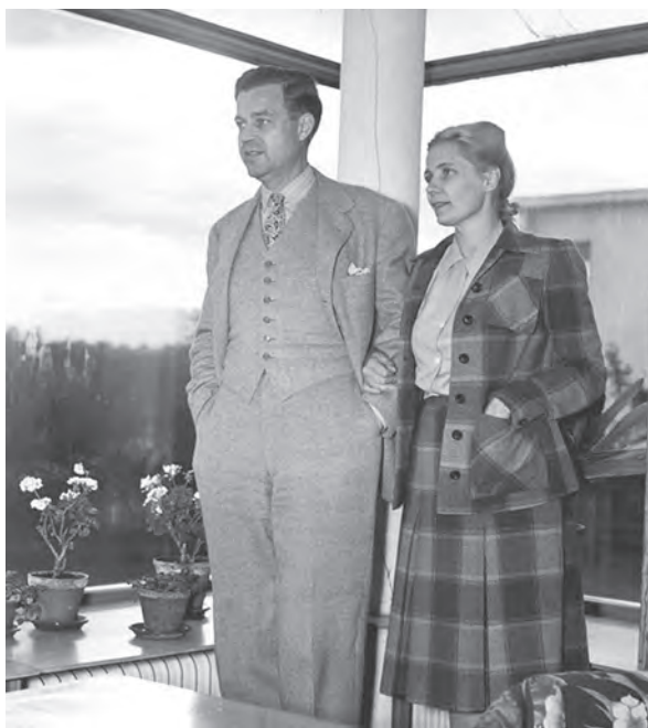
Gunnar och Alva Myrdal i sitt hem i Äppelviken, Stockholm.

kamrater i den matematiskt rättvisa enkammarriksdagen.