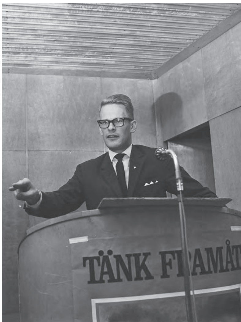
Ingvar Carlsson i den tidigare nämnda debatten från 1966 med Anders Björck.