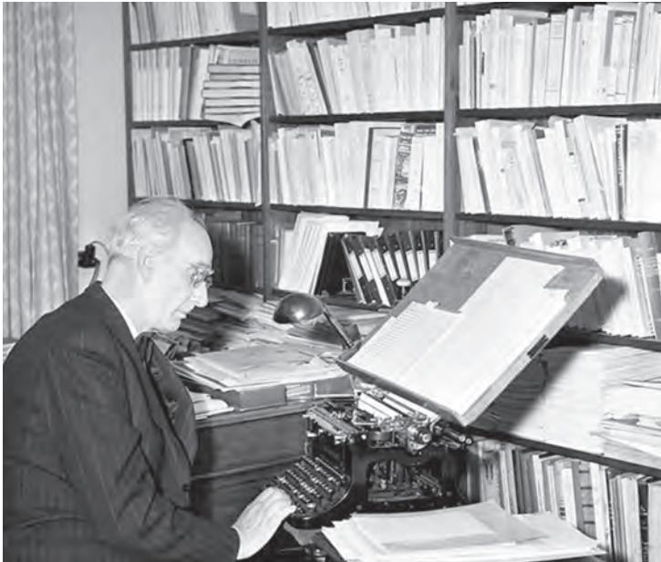
Ture Nerman.

Socialistiska partiets ende representant var Ture Nerman (1931–1937), tidigare och även därefter socialdemokrat i kam-maren (1946–1953). Hans jungfrutal var skrivet på vers, men lyriken försvann i protokollet som inte tog hänsyn till poetens versform med bestämt radfall. Lars Werner (1965–1970) var som nämnts ensam som Vpk-representant, men fick betydligt fler