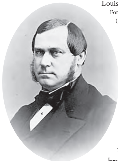
Louis De Geer d. ä.