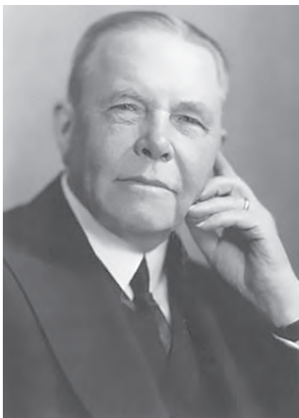
Arvid Lindman. Två gånger statsminister.