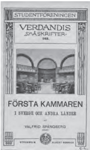
Broschyr. Första kammaren i Sverige och i andra länder, 1906.

Regeringens direktiv till författningsutredningen som tillsattes 1954 betonade således behovet av modernisering av statsförfattningen. Utvecklingen hade urholkat den gällande regeringsformen (från 1809). Vad som gällde i praxis skulle också formuleras i grundlagstexten, det vill säga parlamentarismen skulle skrivas in i författningen.