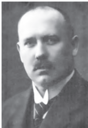
Johan Nilsson.

Rickard Sandler som ledde författningsutredningen hade lämnat riksdagen 1964. Med sina 45 år i första kammaren är han en av dess främsta veteraner. Något längre tid har ändå lantbrukaren och högermannen Johan Nilsson med imponerande många uppdrag i och utanför första kammaren under sina 46 år, 1909–1955. Karriären kröntes med posten som kammarens talman i 18 år. Men vem har den kortaste karriären? Det borde vara socialdemokraten Uno Larsson i Kristinehamn, invald 17 november 1970. Han fick delta i avslut-