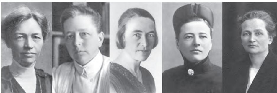
Hösten 1921 ägde det första riksdagsvalet rum där kvinnor var såväl röstberättigade som valbara. Fem kvinnor valdes in i riksdagen. Fr. v. Kerstin Hesselgren, Elisabeth Tamm, Nelly Thüring, Bertha Wellin, och Agda Östlund.

I sitt ”jungfrutal” (debutanföreläsning) den 22 mars 1922 kunde Kerstin Hesselgren inregistrera en framgång. Det mäktiga statsutskottet, vars utlåtanden om statens utgifter oftast blev riksdagens beslut, hade enigt gått emot regeringens förslag om höjda löner för barnmorskorna.