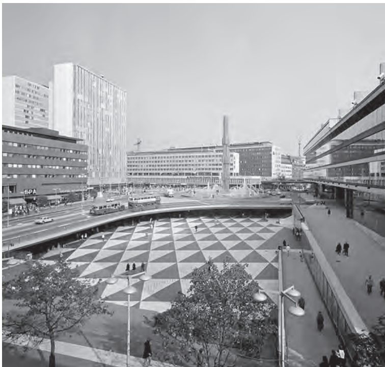
Från Drottninggatan 39 österut mot Sergels Torg. Kulturhuset t.h.