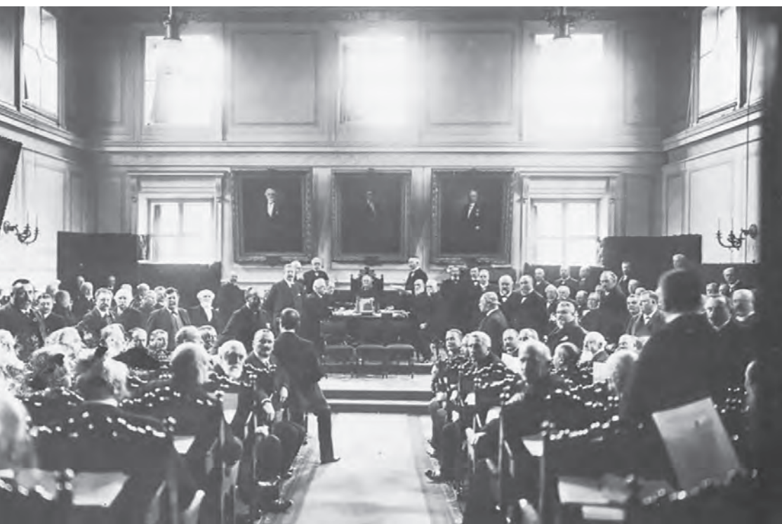
Nyfiket (eller kanske uppmanade därtill) vänder sig första kammarens ledamöter mot fotografen. Året är 1904 och det sista på Riddarholmen. 1905 stod det nuvarande Riksdagshuset vid Helgeandsholmen klart.