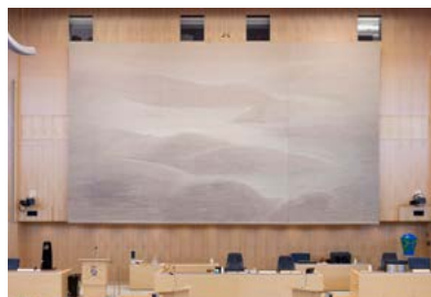
Väven heter "Minnets av ett landskap" och är gjord av textilkonstnären Elisabet Hasselberg Olsson. Den är 54 kvadratmeter, vävd av lin från olika delar av landet och symboliserar Sveriges skiftande natur.

Andra debatter: Ett riksdagsparti kan begära att riksdagen ska debattera ett visst ämne. Talmannen avgör, efter samråd med partierna, om en begärd debatt ska hållas. Under året äger förutbestämda debatter rum en eller flera gånger, till exempel partiledardebatt och utrikespolitisk debatt.